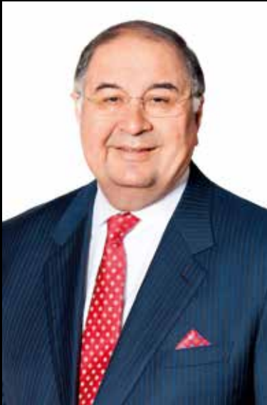
Alisher Usmanov, Presidente de la FIE